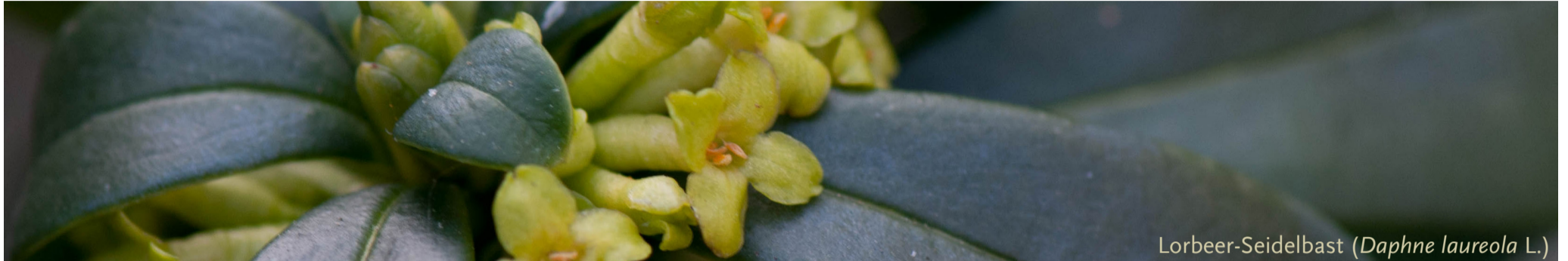
Lorbeer-Seidelbast ( Daphne laureola L.)