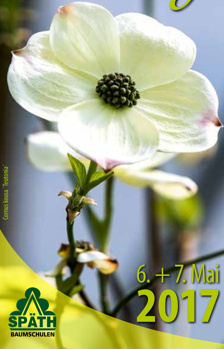
Cornus kousa 'Teutonia'